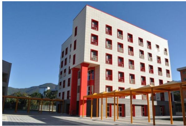
residenze universitarie – campus di fisciano