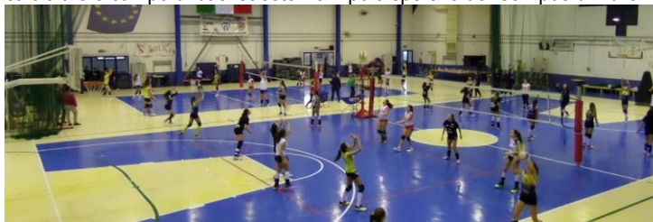
Palazzetto dello Sport – Campus Baronissi