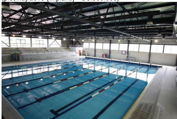
Piscina Coperta – Campus Fisciano