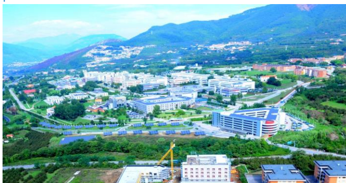
vista campus di Fisciano

Tutte le opere realizzate sono state finanziate con fondi nazionali, regionali, comunitari del tipo FESR, POR, PNS concessi da Ministeri e Regione Campania attraverso articolati procedimenti di ricerca fondi, presentazione di proposte, partecipazioni a bandi, ottenimento di finanziamenti e rendicontazione degli stessi.